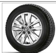
Jantes 16" Clayton