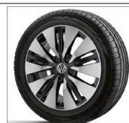
Jantes 18" Teresina

Attention: disponibilité des jantes variable selon les versions