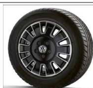
Jantes 17" Posada