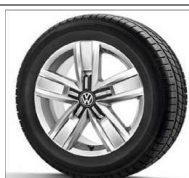
Jantes 17" Devonport